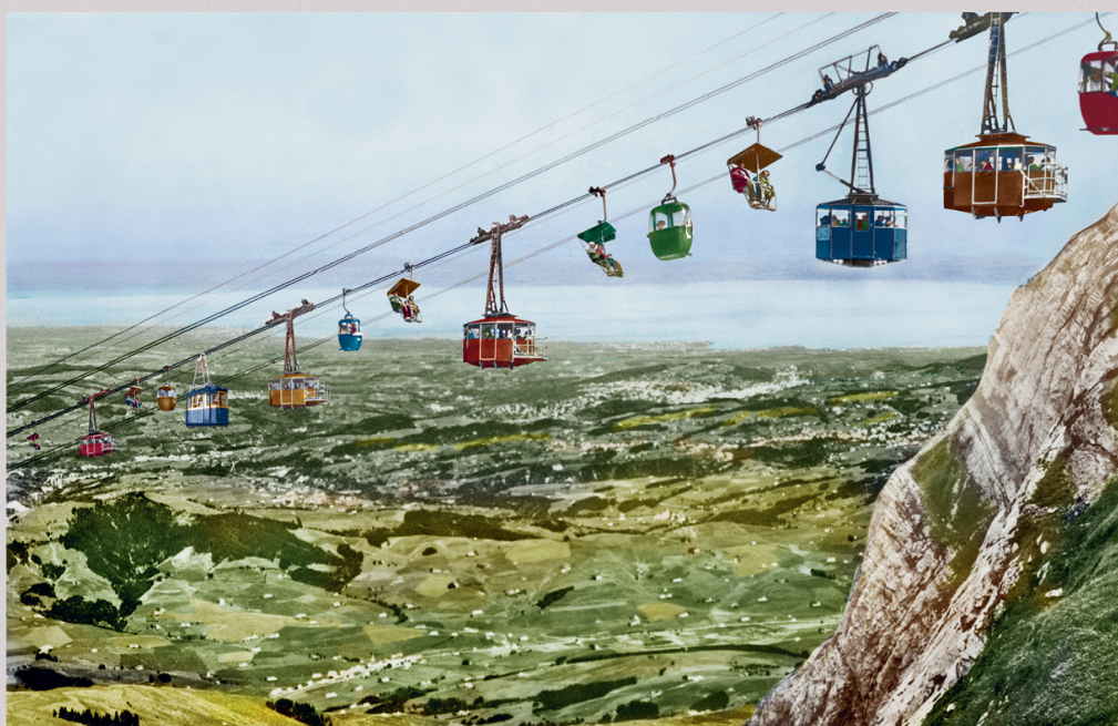
LES DÉPARTS EN VACANCES À LA MONTAGNE

C'était bien mieux après Les belles divagations de Plonk & Replonk – Bébert