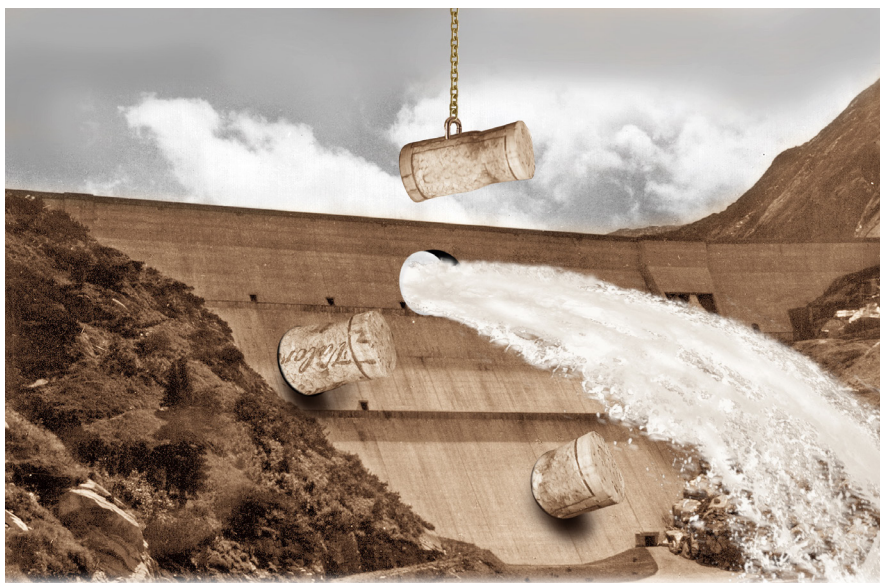
Les barrages sont pleins

Exposition organisée par le Service Culture, Tourisme et Jumelage ainsi que le Service Infrastructures, Mobilité & Environnement de la Ville de Monthey