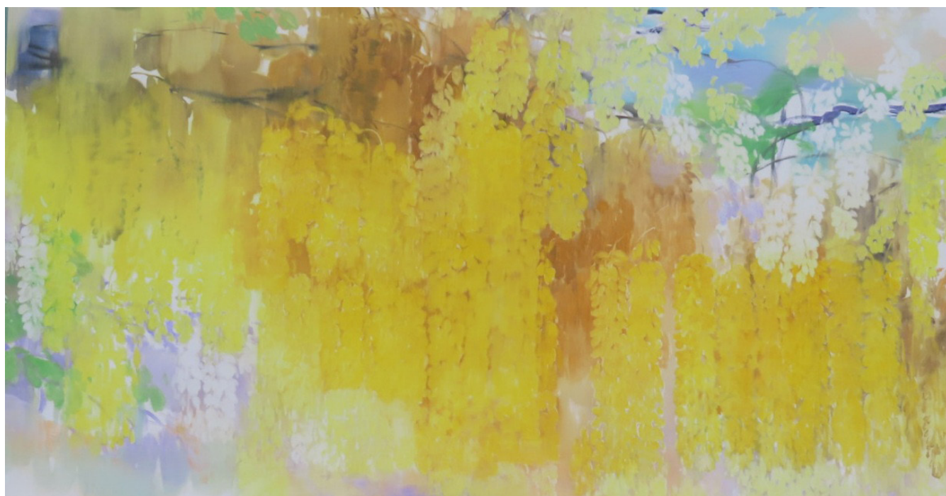
Ambre, or et citron , 2023, huile sur toile, 80 x 150 cm.